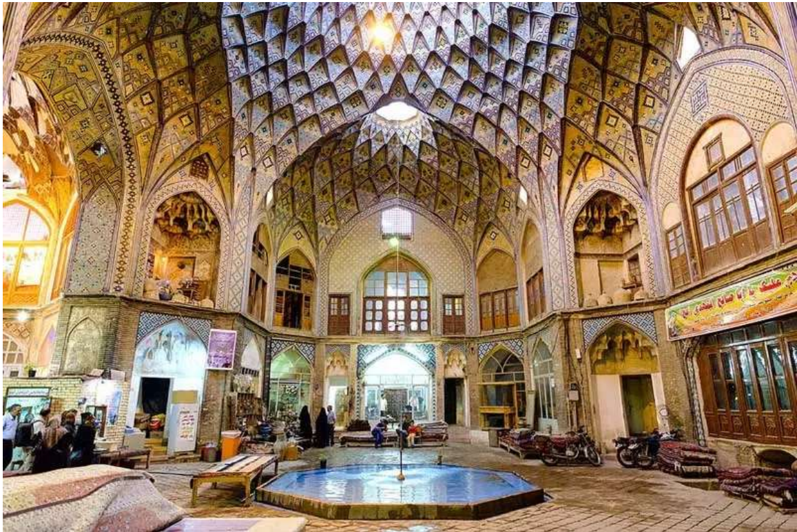
شکل ۲ تیمچه امین‌الدوله کاشان

بی‌نظیر است (حیدری سورشجانی و سلیمی، ۱۳۹۳: ۱۱). دیولافوا معتقد است این تیمچه در اصل یک کاروانسرای اعیانی بوده و برای خدمات‌رسانی ویژه به تجار خاص ساخته شده است. تیمچه امین‌الدوله یک بازارچه ویژه در سه‌طبقه بود که گزارش‌های موجود از همان دوره نشان می‌دهد علاوه بر فضای معماری جذاب و بی‌نظیر که نماینده ساختار فاخر شهر صنعتی و تجارتی کاشان است، همواره پر از کالاهای گران‌قیمت هم بوده است.