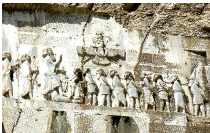
تصویر ۲: نقش داریوش بزرگ و کتیبه او در بیستون ( www.itto.org/ )

این در حالی است که امروزه هیچ نشانی از وجود چنین نقشی بر این کوه دیده نمی‌شود. از این رو چنین به نظر می‌رسد که گزارش یادشده، یک شرح افسانه‌ای از نقش برجسته و سنگ‌نیشته داریوش بزرگ در بیستون (تصویر ۲) بوده است. در این مقاله نخست به این مساله که آیا سمیرامیس اساطیری، در مستندات باستان‌شناختی و تاریخی امکان تاریخ‌مندی مستقل یا تطبیق با چهره‌های شناخته شده داشته‌اند یا خیر، پرداخته نمی‌شود، بلکه در گام اول، این موضوع بررسی خواهد شد که آیا این امکان وجود دارد که در مجموعه نقوش کوه بیستون و پیش از جهان‌شاهی (=امپراتوری) هخامنشی، نقش برجسته‌ای که در آن نقشی از یک زن و دیگر متعلقات توصیف شده همراه آن موجودیت داشته است یا خیر و سپس به بررسی کیستی این شخصیت‌ها پرداخته خواهد شد. همچنین بستری که مطالعه پیش رو در آن انجام گرفته است، «باستان‌شناسی اساطیر» ۱ نام دارد که در ادامه جزئیاتی از چیستی و کارایی آن ارائه می‌شود.