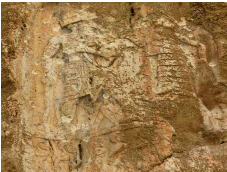
تصویر ۴: نقش و کتیبه اکدی انوبنی‌نی در سر پل ذهاب (نگارندگان، ۱۳۹۱)

۳- در گزارش دیودور از درون مایه کتیبه، این طور آمده که سمیرامیس بر فراز زین‌هایی از جانوران (بارکش یا وحشی) ایستاد تا نقش را ببیند. این موضوع به روشنی می‌تواند بازتاب یک برداشت متاخر از مشاهدات رهگذران و نگارندگان از محتوای نقش در ادوار بعدی بوده باشد، به سخن دیگر، ما در گزارش دیودور با یک تفسیر سطحی روبرو هستیم که در آن، از وضعیتی منطبق بر مستندات حکایت شده است که در آن‌ها، نقوش خدای بانوی اینن به صورت «معلق» در آسمان و یا «پای‌گذارده بر یک جانور» (تصویرهای ۴ و ۵) ترسیم شده بودند.