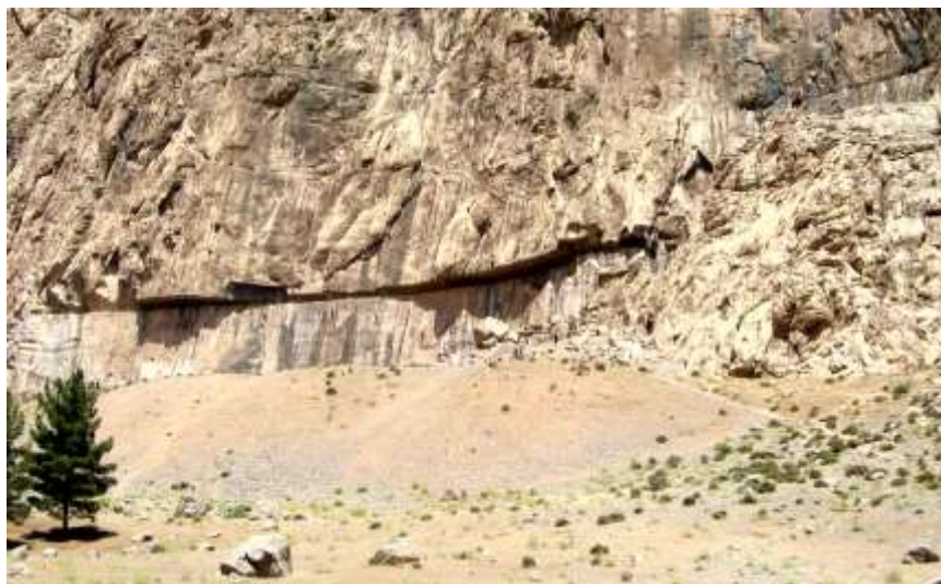
تصویر ۱: محوطه فرهادتراش و قاب ناتمام آن بر فراز یک تپه در پایین‌ترین نقطه از کوه بیستون (نگارندگان، ۱۳۹۱)

که در آن جا، نقشی از یک زن و ستونی منتسب به او وجود داشته است ( Isidore of Charax, The Parthian ) (Stations: 5).