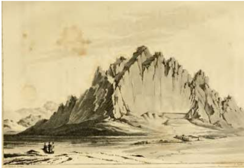
تصویر ۳: نقاشی کتاب کر پورتر از کوه بیستون و قاب ناتمام فرهادتراش ( Ker Porter, 1822: 151 )

بعدها متعلق به داریوش شناخته شد و نقوش تخت جمشید در یک دوره ایجاد شده‌اند و نظر او از سوی جورج کیپل ۱ نشر داده شد ( King & Thompson, 1907: xiv-xv ). رابرت کر پورتر ۲ در سال ۱۸۱۸ میلادی، با وجود قیاس برخی مولفه‌ها چون لباس برخی از نقوش با جامه‌های نقش شده در تخت جمشید، اما در نهایت محتوای نقش داریوش بزرگ در بیستون را مرتبط با یک گزارش توراتی و اسارت و انتقال گروهی از بنی اسرائیل به شهرهای مادی به دست شلمانسر (شلمنصر) پنجم ۳ (۷۲۲-۷۲۷ پ.م.) پنداشت ( Ker Porter, 1822: 154-162 ). البته مترجم کتاب جکسون به اشتباه این شاه آشوری را شلمانسر سوم معرفی کرده است (جکسون، ۱۳۸۷: ۲۰۷، زیرنویس ۴). با وجود اشاره به داستان دیودور از نقش سمیرامیس و عدم رویت نشانه‌های آن در محوطه، اما به طرز جالبی کر پورتر کوشیده است تا درباره افسانه‌ای بودن یا نبودن آن دست به داوری نهایی نزد و حتی نوشته است که در صورت درستی چنین چیزی، آن می‌تواند قدیمی‌ترین پیکره در امپراطوری (?). به شمار آید ( Ker Porter, 1822: 153 ). همچنین کر پورتر تصویری از کوه بیستون را نیز در کتاب خود ترسیم کرده که در آن قاب فرهادتراش به چشم می‌خورد (تصویر ۳).