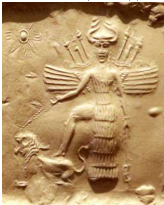
تصویر ۵: نقش خدای بانوی اینن-ایشتار که پا بر روی یک جانور وحشی گذاشته است (صکب البیجاوی، ۱۳۹۹)

۳- در گزارش دیودور از درون مایه کتیبه، این طور آمده که سمیرامیس بر فراز زین‌هایی از جانوران (بارکش یا وحشی) ایستاد تا نقش را ببیند. این موضوع به روشنی می‌تواند بازتاب یک برداشت متاخر از مشاهدات رهگذران و نگارندگان از محتوای نقش در ادوار بعدی بوده باشد، به سخن دیگر، ما در گزارش دیودور با یک تفسیر سطحی روبرو هستیم که در آن، از وضعیتی منطبق بر مستندات حکایت شده است که در آن‌ها، نقوش خدای بانوی اینن به صورت «معلق» در آسمان و یا «پای‌گذارده بر یک جانور» (تصویرهای ۴ و ۵) ترسیم شده بودند.