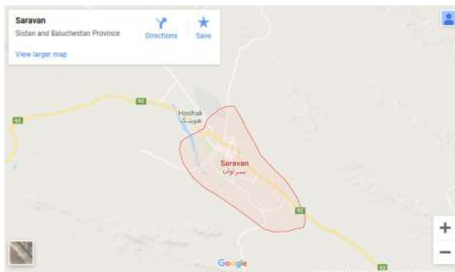
موقعیت جغرافیایی شهرستان سراوان