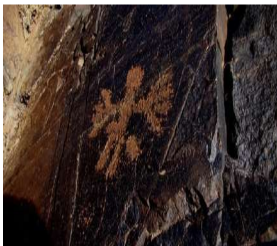
تصویر ۲. نمونه ای از انسان بالدار یا انسان درحال عبادت