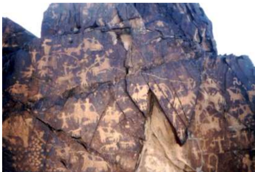
تصویر ۷. نمونه ای دیگر از نقوش سنگ نگاره