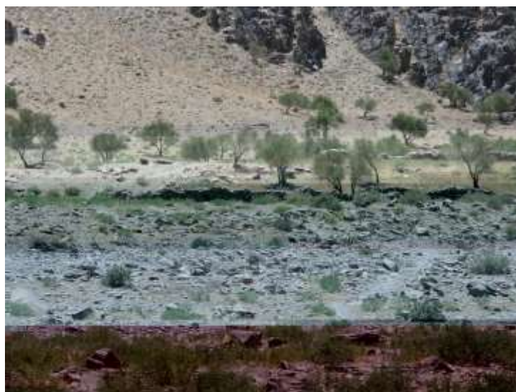
تصویر نمای کلی از دره نگاران