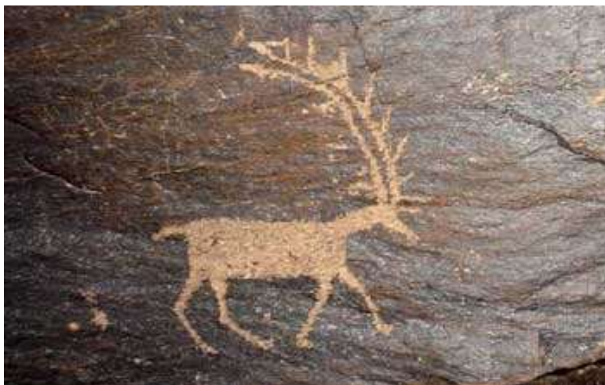
تصویر ۱. نقش بز بر صخره