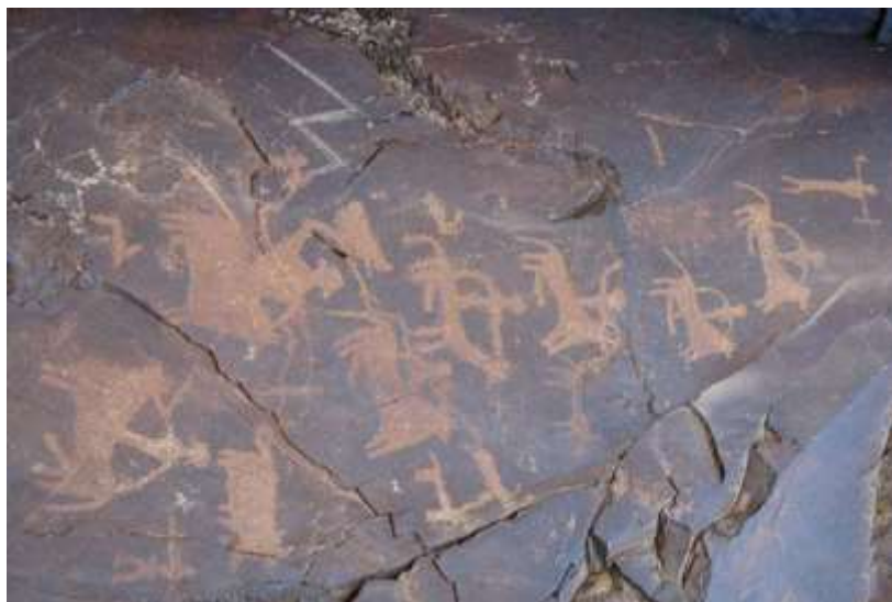
تصویر ۶. نمونه نقوش سنگ نگاره های سراوان