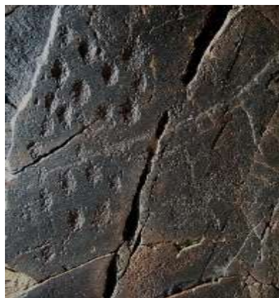
تصویر ۴. نمونه ای از فنجان نما در دره نگاران

تصویر ۳. شبه عقاب یا به تعبیری عقاب چهره که شبیه به آن در سنگ نگاره های دیگر نقاط ایران و جهان نیز دیده شده است.