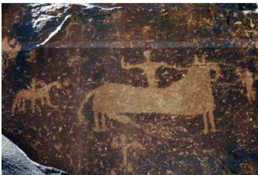
تصویر ۵. نقش سنگ نگاره